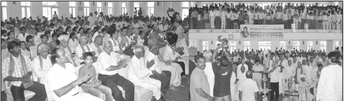
आर्यों से खचाखच भरे योग निकेतन सभागार का सुन्दर दृश्य