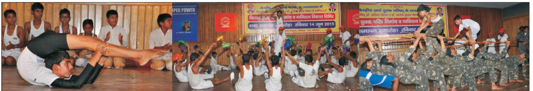
कठिन योगासन, लेजियम व कमाण्डो का प्रदर्शन करते हुए शिविरार्थी