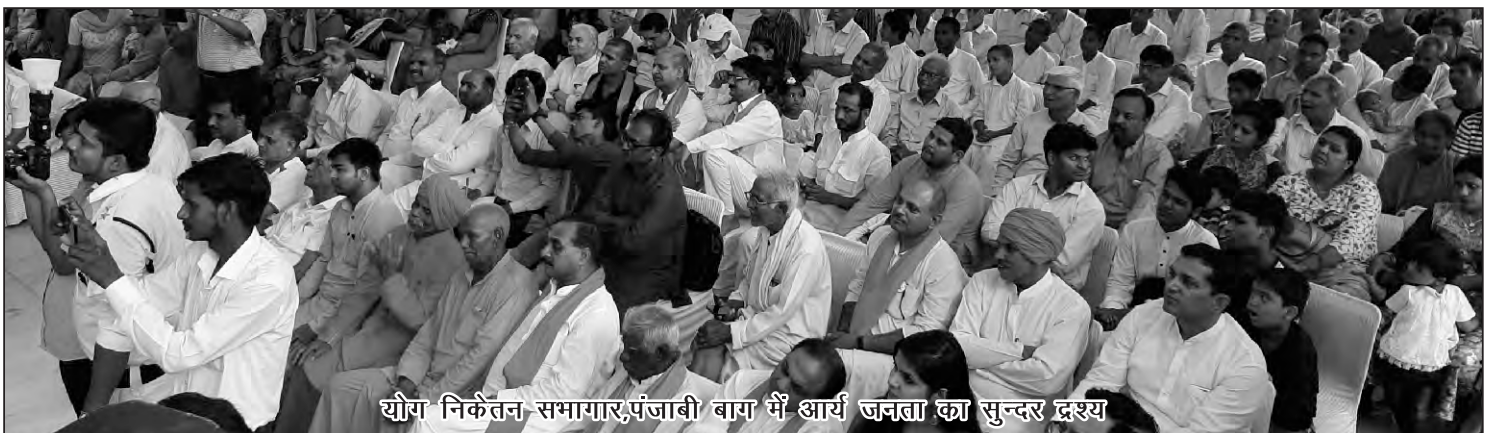
योग निकेतन सभागार, पंजाबी बाग में आर्य जनता का सुन्दर द्रश्य