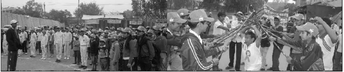
ध्वजारोहण के समय आर्य युवक व युवतियां व व्यायाम प्रदर्शन करते आर्य युवक।